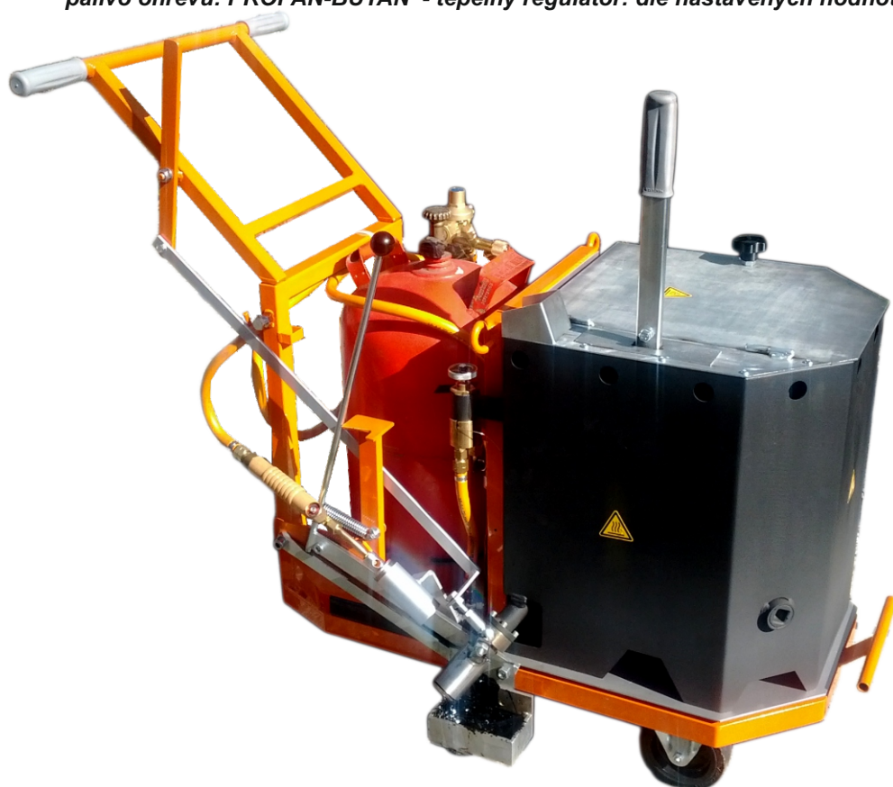
DICOREL 3001 Eco

objem ohřívací nádoby: 40litrů - způsob ohřevu: nepřímý - váha: 93kg palivo ohřevu: PROPAN-BUTAN - tepelný regulátor: dle nastavených hodnot